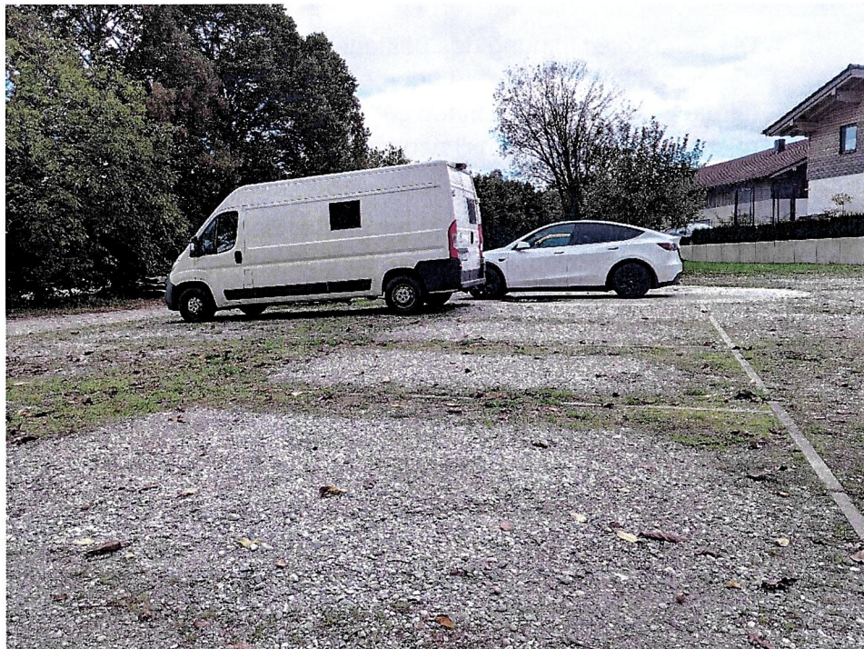
Abb. 2 Ansicht des Plangebiets von Südwesten (Baumbestand außerhalb des Plangebiets), Fotografie PV München September 2025

Der nördliche Teilbereich der Fl.Nr. 4693 wird mit der Satzungsänderung in den planungsrechtlichen Innenbereich einbezogen. Es wird somit neues Baurecht geschaffen. Jedoch wird die neu ermöglichte Bebauung durch die Festsetzung einer überbaubaren Grundstücksfläche auf einen bestimmten Bereich begrenzt, in dem sich im Bestand derzeit offene Stellplätze befinden. Die Flächen sind aufgekiest und stark verdichtet. Des Weiteren befindet sich hier eine ehemalige Güllegrube, die zu einer Löschwasserentnahmestelle umfunktioniert wurde und oberirdisch versiegelt ist. Die Bodenfunktionen sowie die Versickerungsleistung sind in der Fläche somit stark eingeschränkt, eine Bedeutung für Arten und Lebensräume sowie Luft und Klima besteht nicht. Durch die bestehende Nutzung als Parkplatz besteht auch keine Bedeutung für das Landschaftsbild. Im Gebiet liegen somit nur Flächen, die gemäß Liste 1a des Anhang 1 des Leitfadens „Bauen im Einklang mit Natur und Landschaft“ (Bayerisches Staatsministerium für Wohnen, Bau und Verkehr; Anhang 1 Liste 1a) eine geringe Bedeutung für Natur und Landschaft haben.