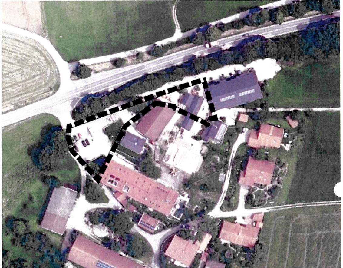
Abb. 1 Plangebiet, ohne Maßstab, Quelle: © Bayerische Vermessungsverwaltung, 2023